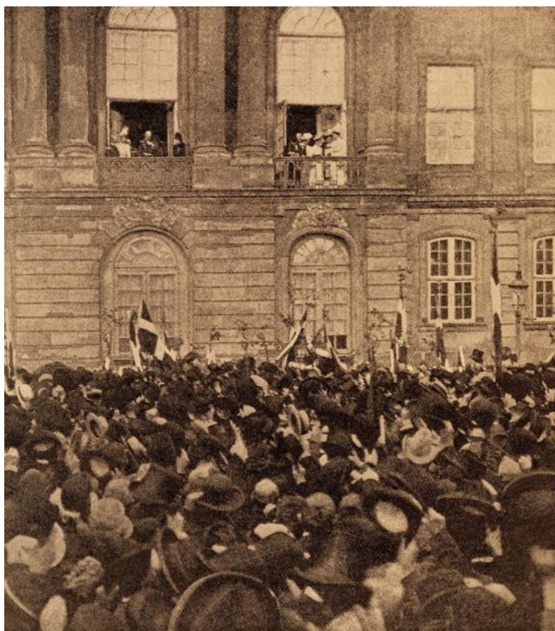
I glæde over systemskiftet gik tusindvis af københavnere i optog til Amalienborg den 1. september 1901.

Det betyder, at regeringen skal gå af, hvis et flertal i Folketinget kræver det. Grundlovsændringen i 1953 afskaffede også Landstinget.